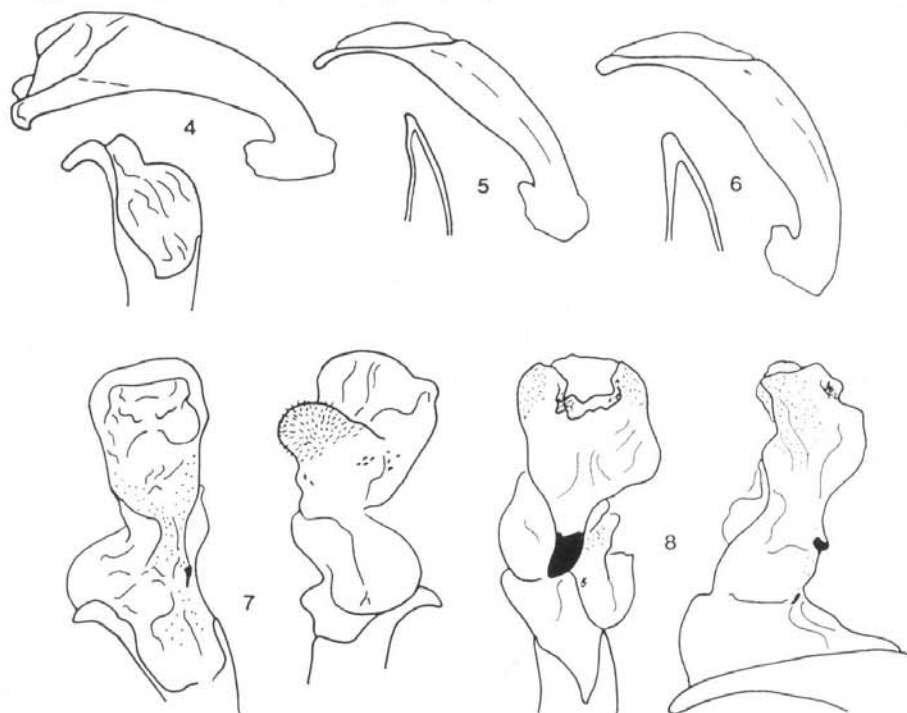
4 à 8. Edéage du mâle : 4 et 7. C. (Rhigocarabus) huyuenii sp.n. (HT) ; 5 et 8. C. (s.str.) shansutiaensis sp.n. (HT) ; 6. C. (s.str.) battoniensis nanpingensis .